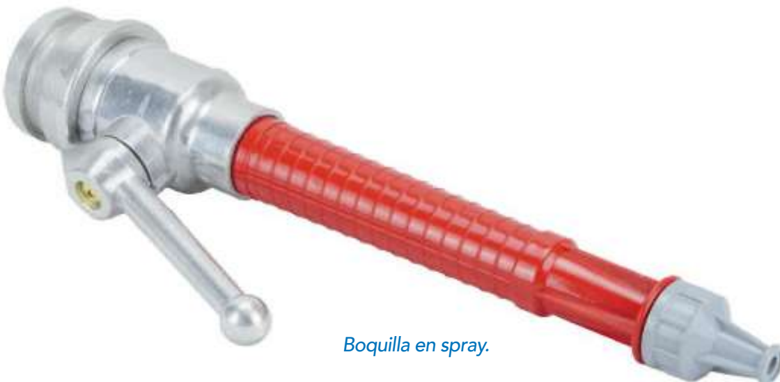
Boquilla en spray.

una palanca. Sus diferentes adaptadores de entrada hacen de esta boquilla una solución idónea para variadas aplicaciones en la industria. Con una excelente relación calidad precio, está disponible tanto en aleación y plástico como en aleación ligera, que es algo más resistente. La gama n° 1 C crea, incluso, un escudo mientras que simultáneamente dispara un potente chorro.